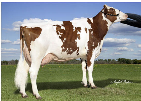
BACON-HILL ALD RAIVE-RED GRANDDAM